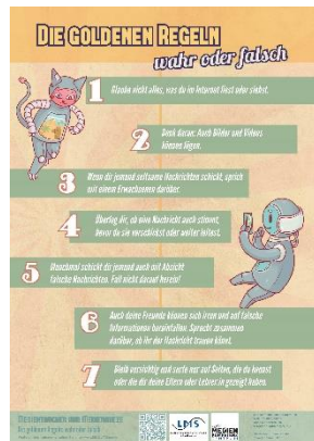
Medienregeln wahr oder falsch