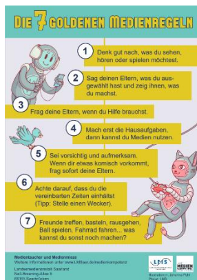
Medienregeln Leichte Sprache